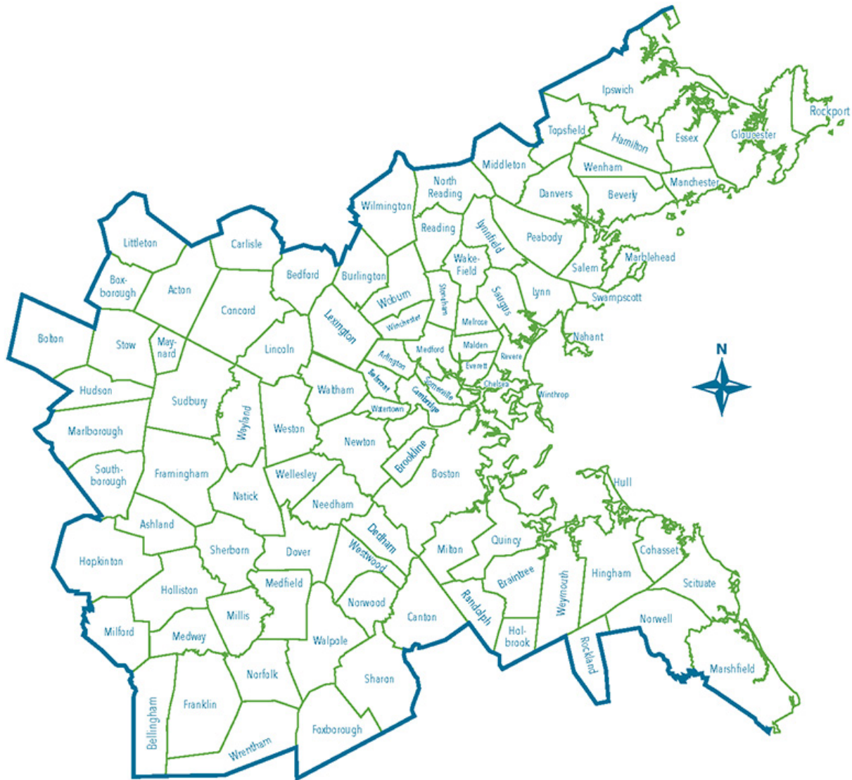
BOSTON REGION METROPOLITAN PLANNING ORGANIZATION MUNICIPALITIES